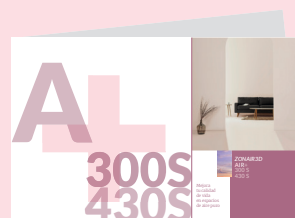
Manual de usuario