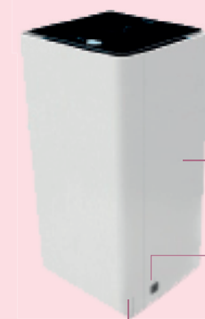
Panel delantero fijo