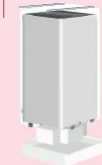
Air+ 300 S / 430 S